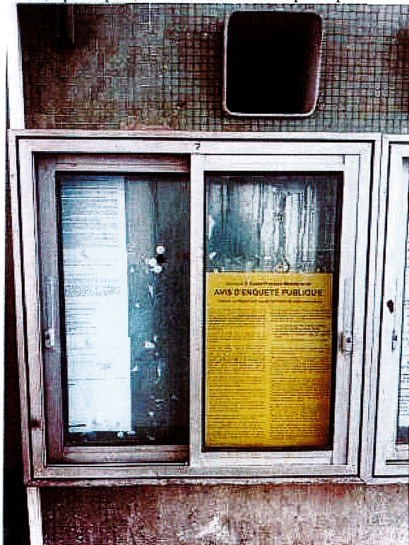
Mairie principale, 275 Avenue de la République :