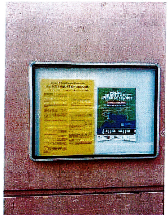
Mairie annexe, 447 Avenue du 15ème corps :